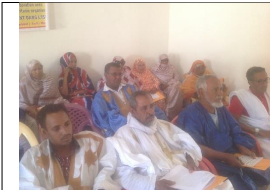
Formation des acteurs régionaux A kiffa