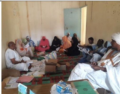
Formation des relais de Barkéol