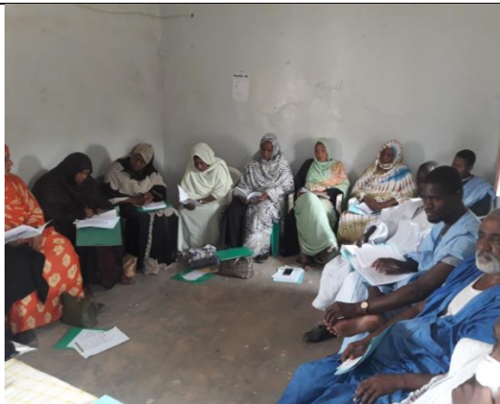
Formation des relais de Barkéol