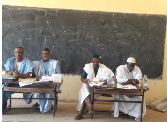
Formation relais de Mbout