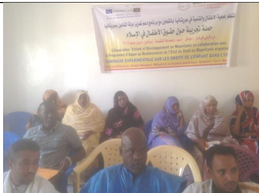
Formation des acteurs régionaux A kiffa